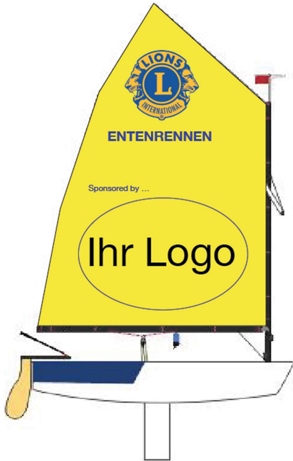
Meshgewebe 340 cm x 173 cm

Vorschlag für eine Sponsoren-Einbindung auf einer Werbefläche (z.B. Riesen-Ente) im Wedeler Hafenbecken.