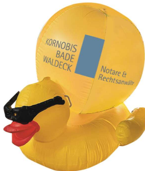
Logo Fläche ca. 1130 x 380 mm